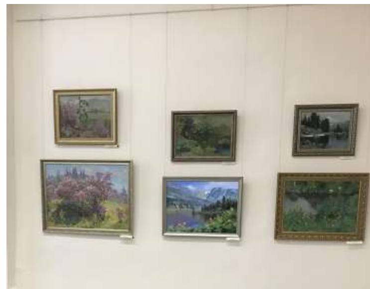
Фрагмент экспозиции выставки «Диалог длиною в век», март 2020 года.