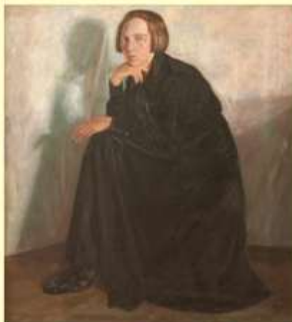
Портрет жены в черном. 1919 г.